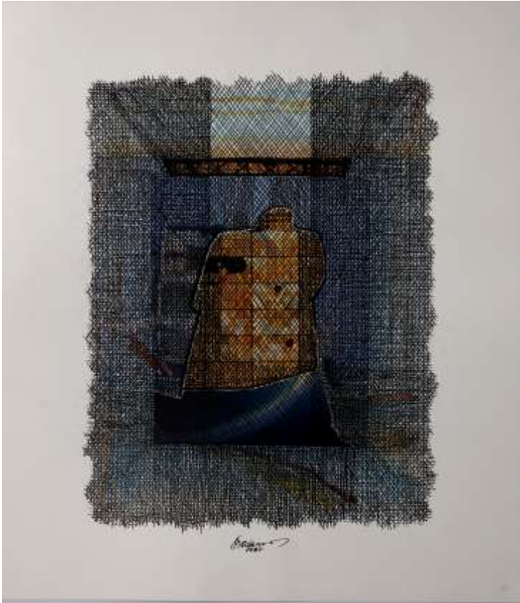
Hellmuth Bodenteich, Collage-Mischtechnik, 1987