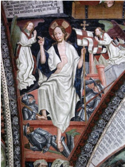
Auferstehung Christi (5. Arkade)