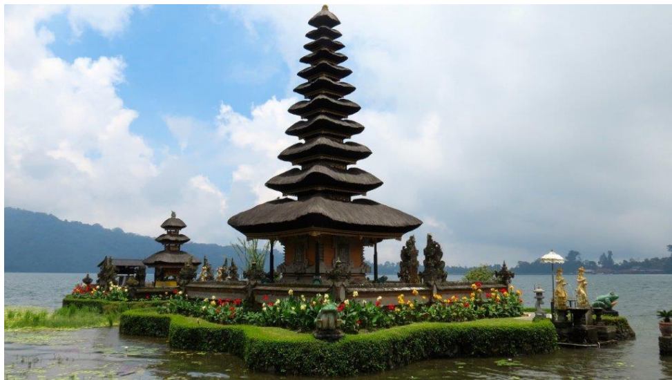
Bali Pura Ulun Danu