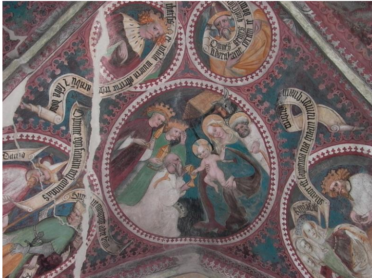
Anbetung der Könige (9. Arkade)