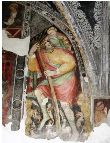
Christophorus (12. Arkade)