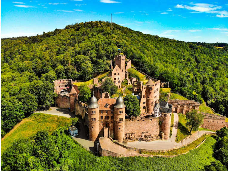
Kulturreise 2024 – Burg Wertheim