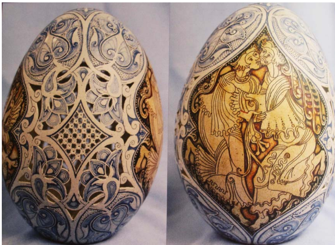
Gabriella Szutor (Ungarn) – Internationale Eierbörse