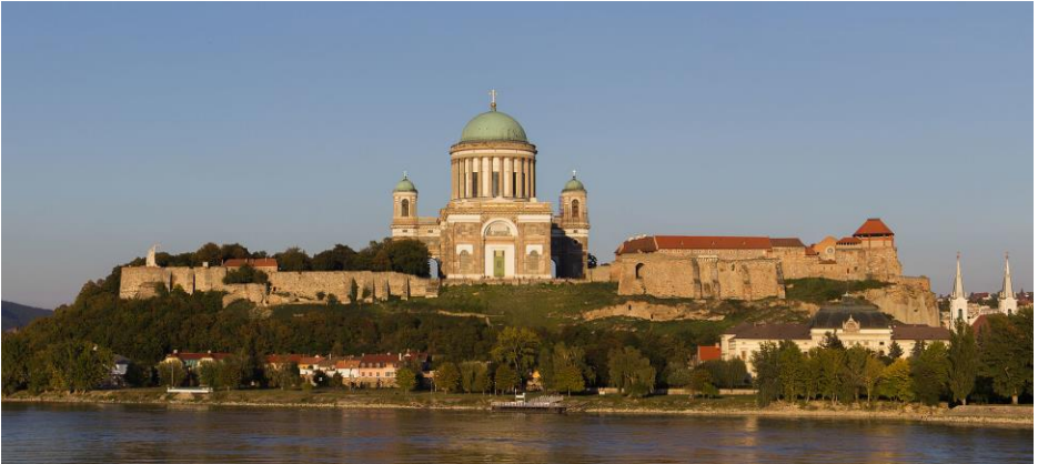
Esztergom – Dom Mariä Himmelfahrt