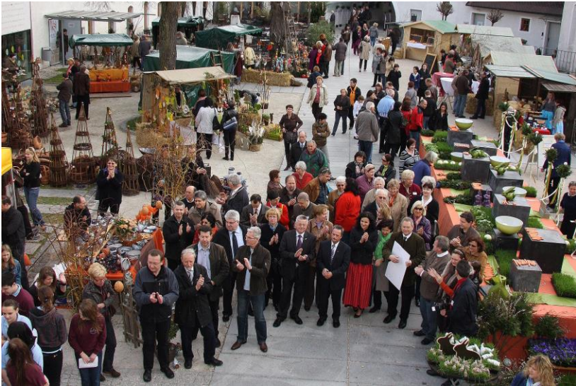
So präsentiert sich alle Jahre der Schlosshof bei der Eröffnung des Ostermarktes. Immer mit dabei ein Bläserensemble der LMS Traun.