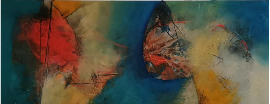
„Wir sehen uns später?!“