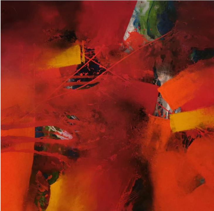
„Reise ins Nirwana“