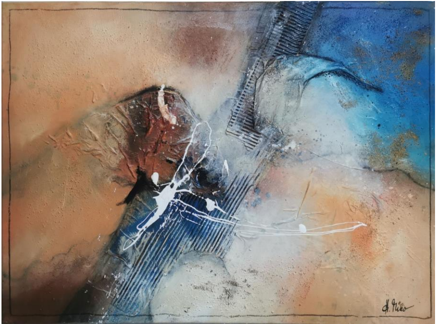
„See you later?!“