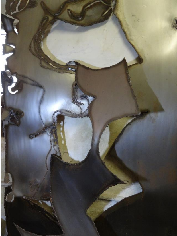
Veronika Kunze: „Mut zur Lücke“

Kunst verbindet und lässt zu, auch außerhalb des Tellerrandes Themen sichtbar zu machen. Wir wissen, dass Kreativität in uns allen lebt und auch wartet mehr und mehr gelebt zu werden.