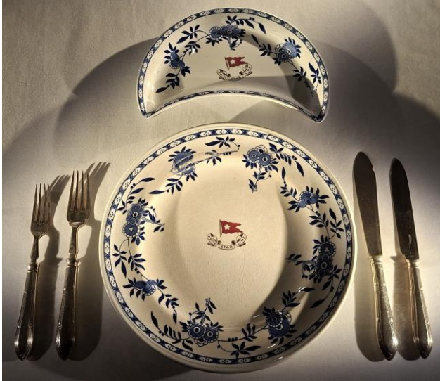
Speiseservice auf der Titanic 1912