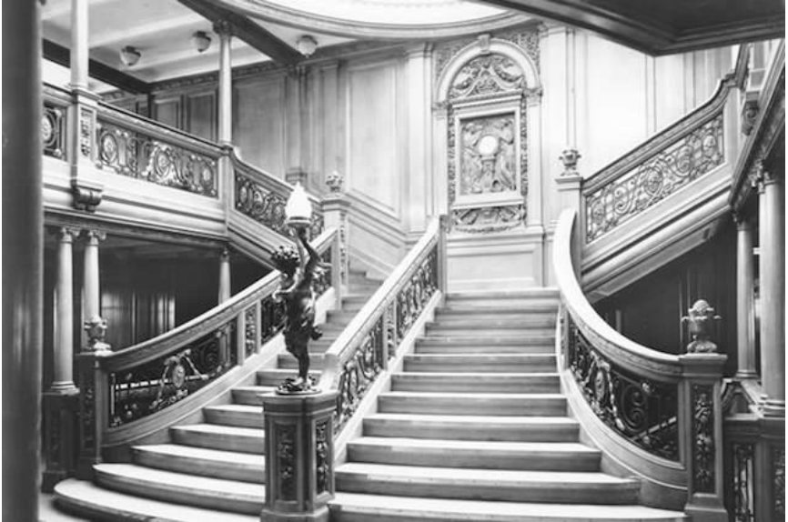
Die berühmte große Treppe der Titanic

Zu Beginn des 20. Jahrhunderts wuchsen die Unterschiede zwischen den sozialen Klassen immer weiter. Die Reichen waren extrem reich und die Armen sehr arm.