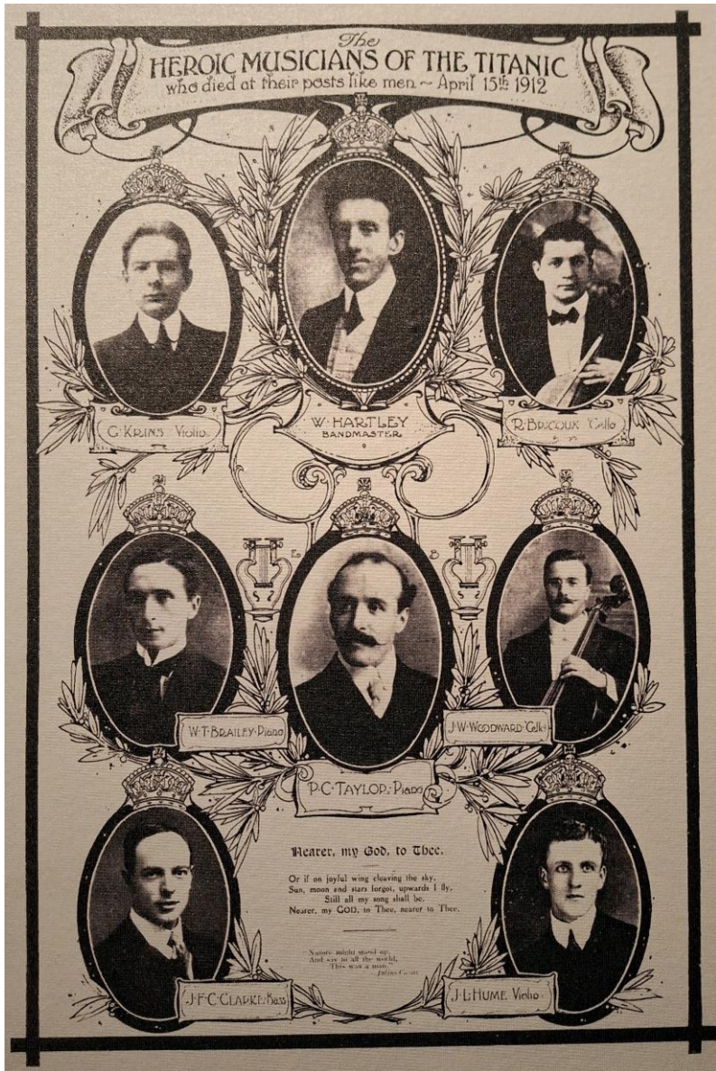
Die Musiker der Titanic im Jahr 1912